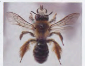
シロスジフデアシハナバチ