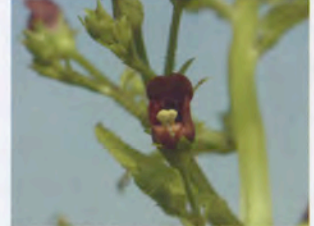
オオヒナノウスツボ

★ニュース 平成29年度 彩の国埼玉環境大賞・優秀賞を受賞しました。これを励みにこれからも活動します。応援よろしくお願いたします。