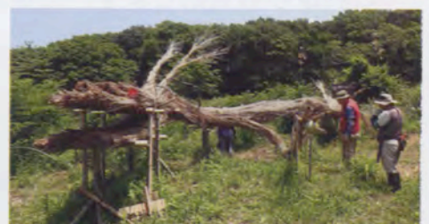
「見沼の龍 龍神マルコ」