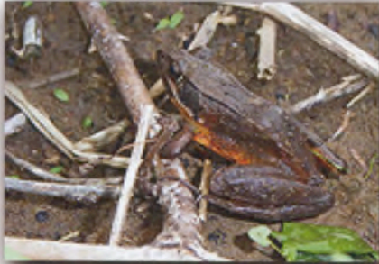
ニホンアカガエル

減少しているアカガエルを保護するため 2012 年 12 月 NPO 法人を立ち上げました。つながりの視点を持つことで多様な活動を行なっています。平成 29 年度彩の国埼玉環境大賞優秀賞を受賞しました。